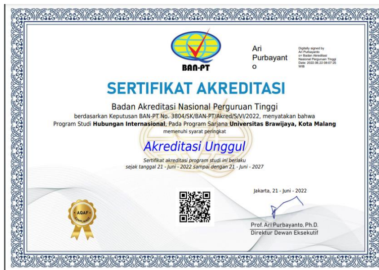
Gambar 3.8.1 – Sertifikat Akreditasi PS S1 Hubungan Internasional

Hasil akreditasi kemudian keluar pada tanggal 22 Juni yang memperlihatkan hasil akreditasi Unggul yang didapatkan oleh Prodi HI dengan nomer SK BAN-PT No. 3804/SK/BAN-PT/Akred/S/VI/2022