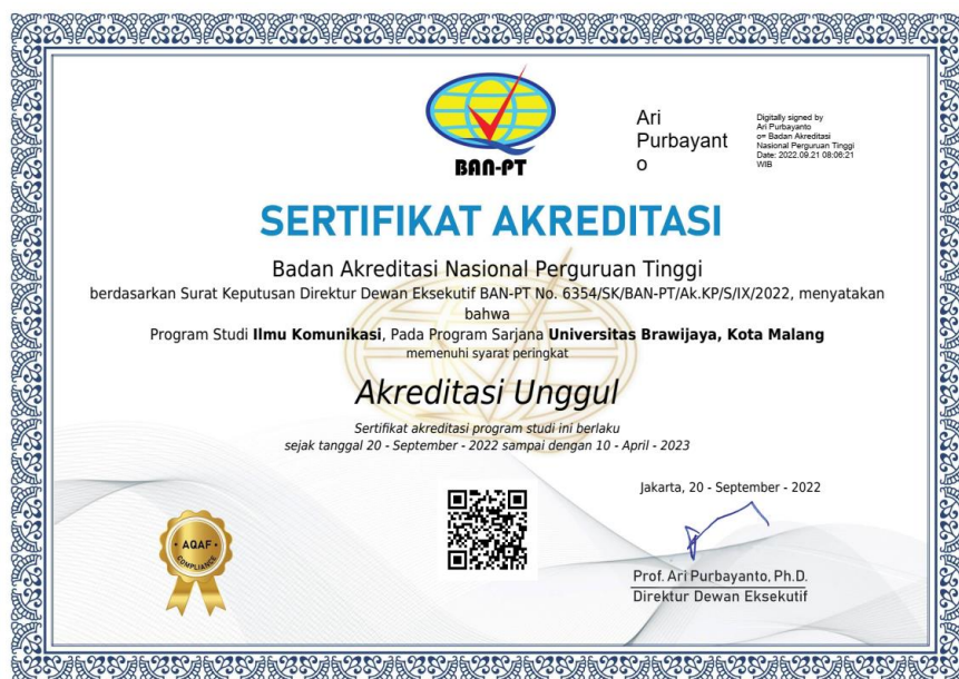
Gambar 3.8.5 – Sertifikat Akreditasi PS S1 Ilmu Komunikasi

Selain akreditasi dari PS S1 HI dan Psikologi, PS S1 Ilmu Komunikasi juga melakukan identifikasi ISK pada September 2021 dengan semakin intensif pada tahun 2022. Identifikasi ISK termasuk di dalamnya beberapa identifikasi indikator ISK (Instrumen Suplemen Konversi) untuk menyetarakan peringkat akreditasi yang dihasilkan dengan Instrumen Akreditasi 7 Standar dan Instrumen Akreditasi 9 Kriteria.