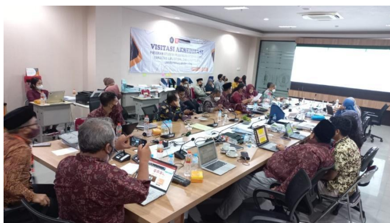
Gambar 3.8.2 – Proses Akreditasi PS S1 Hubungan Internasional

Akreditasi kedua dilakukan oleh PS S1 Psikologi FISIP UB dengan persiapan berupa penyusunan LKPS dan LED yang dilakukan sejak Bulan Agustus 2021 hingga Mei 2022. Pengiriman borang akreditasi dilakukan pada Bulan Mei 2022. Proses visitasi dilaksanakan pada tanggal 13-15 Juli 2022 bertempat di Gedung FISIP C lantai 7 dalam proses akreditasi.