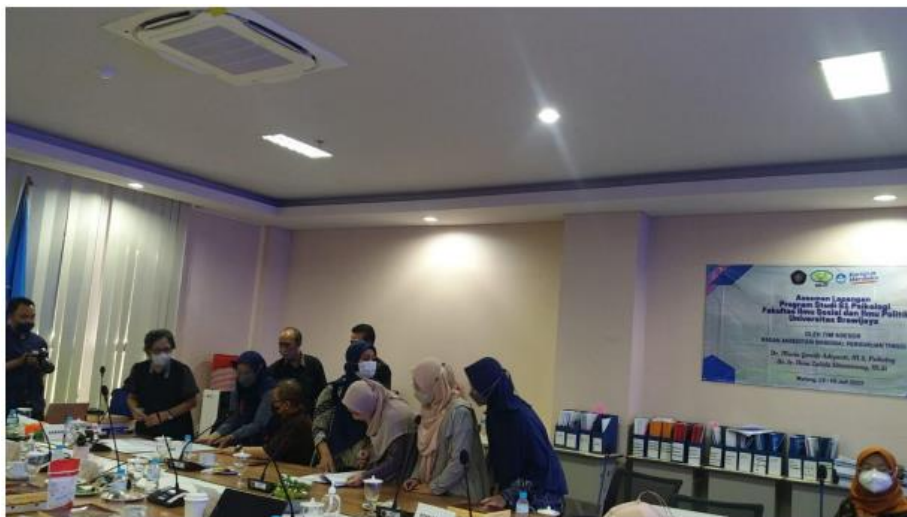
Gambar 3.8.3 – Penandatanganan berita acara Akreditasi PS S1 Psikologi