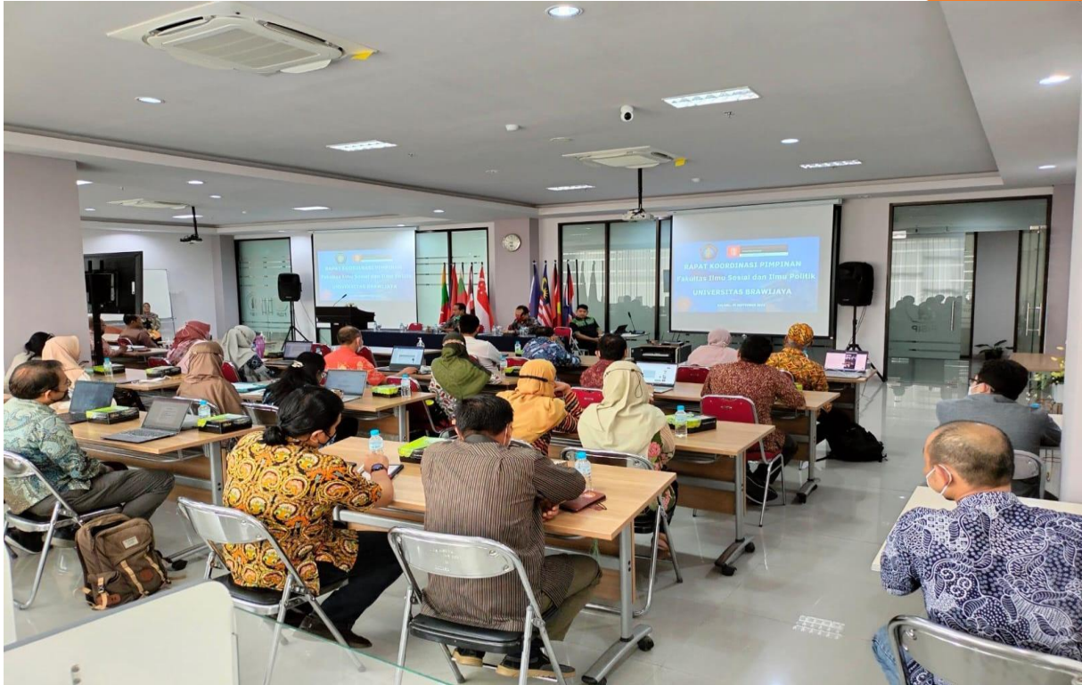
Gambar 5.1 Rapat Tinjauan Manajemen Fakultas Ilmu Sosial dan Ilmu Politik tanggal 30 September 2022