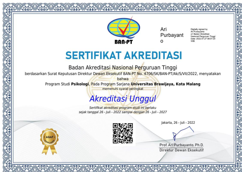
Gambar 3.8.4 – Sertifikat Akreditasi PS S1 Psikologi

Selain akreditasi dari PS S1 HI dan Psikologi, PS S1 Ilmu Komunikasi juga melakukan identifikasi ISK pada September 2021 dengan semakin intensif pada tahun 2022. Identifikasi ISK termasuk di dalamnya beberapa identifikasi indikator ISK (Instrumen Suplemen Konversi) untuk menyetarakan peringkat akreditasi yang dihasilkan dengan Instrumen Akreditasi 7 Standar dan Instrumen Akreditasi 9 Kriteria.